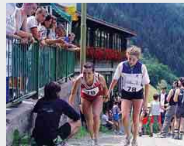
In alto una fase della gara, sopra a sinistra l'arrivo vittorioso della coppia maschile, a destra quella femminile