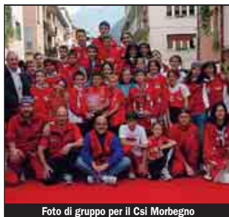
Foto di gruppo per il Csi Morbegno